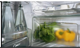
TABLE TOP CFL 195 / 1 E